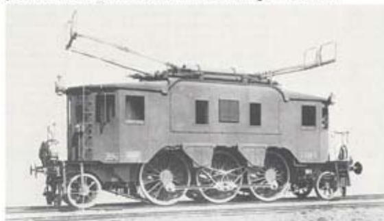
E.330.005 nella versione originale, vista dal lato posteriore destro (reostato)